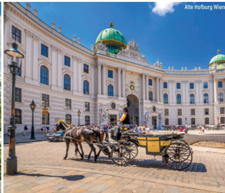
Alte Hofburg Wien