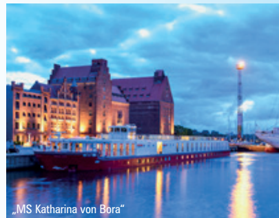
„MS Katharina von Bora“