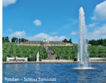
Potsdam – Schloss Sanssouci